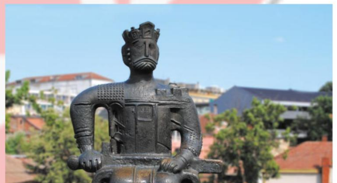
Spomenik knezu Lazaru