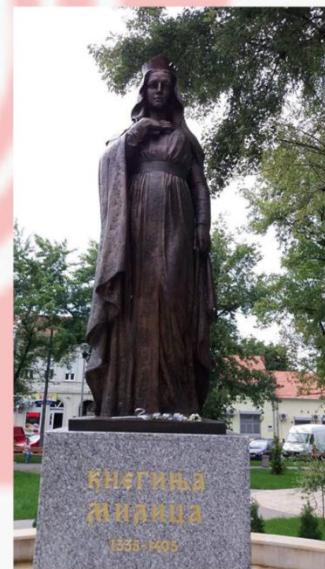
Spomenik kneginji Milici