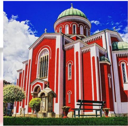
Crkva Svetog Djordja